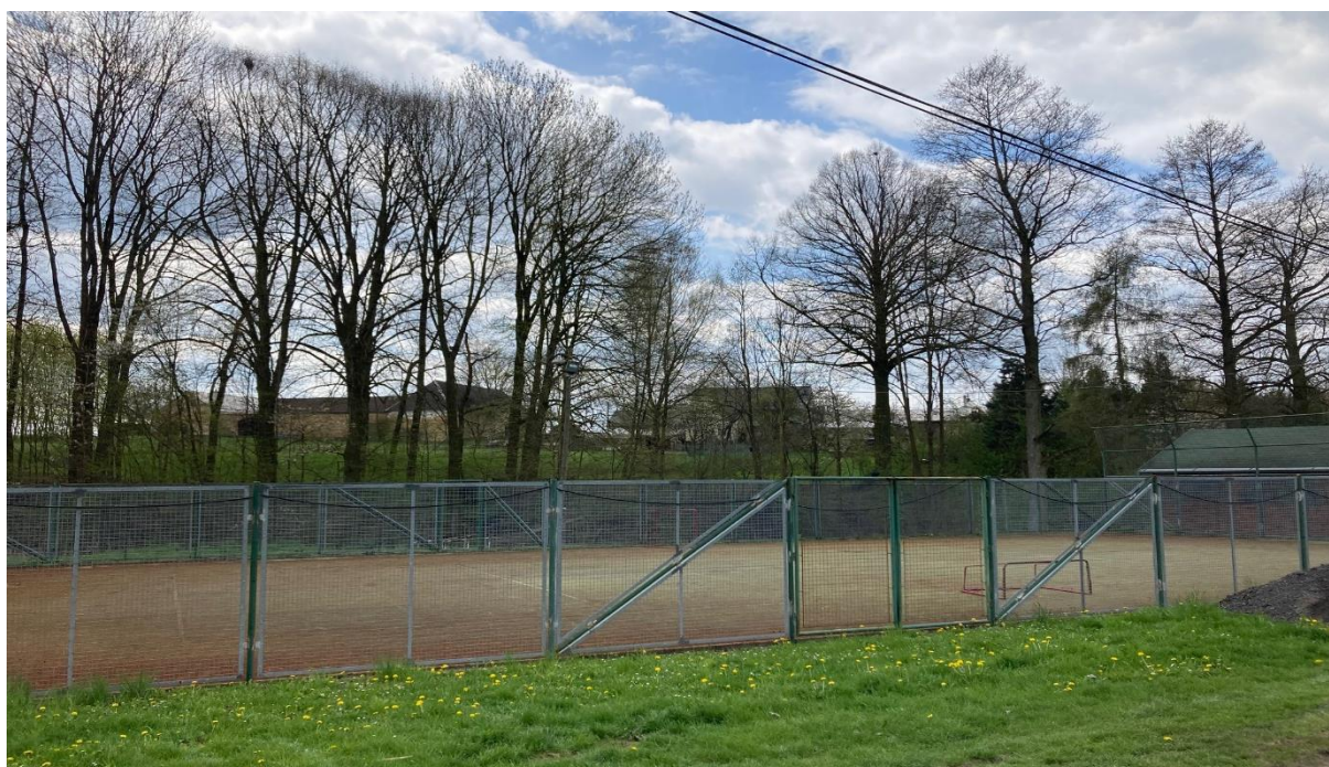
Obrázek 2: Multifunkční hřiště 3

Sport v obci zastupuje pouze Sbor dobrovolných hasičů. V obci se nachází fotbalové hřiště a multifunkční hřiště s umělým povrchem. U multifunkčního hřiště je zbudované sociální zázemí a zázemí pro prodej. V obci chybí dětské hřiště. To se nachází pouze v prostoru MŠ a je určeno výhradně pro potřeby MŠ. Dále v obci chybí prostory tělocvičny pro vnitřní sportovní vyžití.