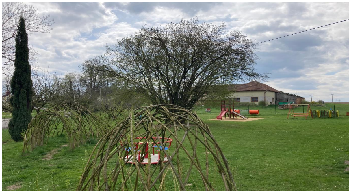
Obrázek 3: Zahrada u MŠ 4

Místní spolek SDH a mateřská škola se aktivně podílí na realizaci různých sportovních a kulturních akcí. A společně s občany tak mohou aktivně trávit volný čas a udržovat dobré přátelské vztahy mezi sebou. Kulturní a společenské akce většinou probíhají buď na hřišti nebo na veřejných prostranstvích obce. Tyto akce organizují spolky ve spolupráci s vedením obce a podílejí se tak na aktivním a smysluplném trávení volného času. Z pravidelně konaných akcí lze zmínit hasičský ples, rozsvěcení vánočního stroměčku, dětský den, dětrichovský memoriál nebo sportovní turnaje.